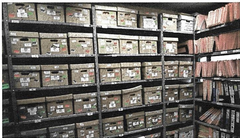
אלפי ילדים נעלמו או נפטרו ללא מידע על מקום הימצאם. זו אחת מוועדות החקירה בנושא

150 אלף שקלים עבור ילד שנפטר, 200 אלף שקלים לנעדה. זה הפיצוי שעליו החליטה הממשלה להעניק למשפחות ילדי תימן האבודים • עו"ד אביתר קציר שייצג את המשפחות: "לא נפסיק את המאבק" • עו"ד רמי צוברי: "המדינה לא מודה באשמה, והמשפחות דורשות צדק, לא כסף"