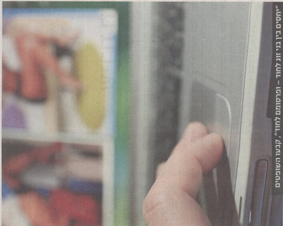
"יחסים בין בני זוג לחדר - ומרטום לחדר", קבעו השופטים

התובעת מיהרה לפנות לאתר הפורנו בדרישה להסיר את הסרטון, ובמקביל פנתה לבית המשפט בדרישה לחייב את החבר לשעבר לשלם לה פיצויים בגין הפגיעה בפרטיותה. לטענתה הסרטון צולם באופן ספוי בסניף ביוממו של החבר לשעבר וכי מצלמה שלו, ולאחר מכן היא ביקשה ממנו להסתיי את הקלטת כדי שאף אחד לא יראה אותה.